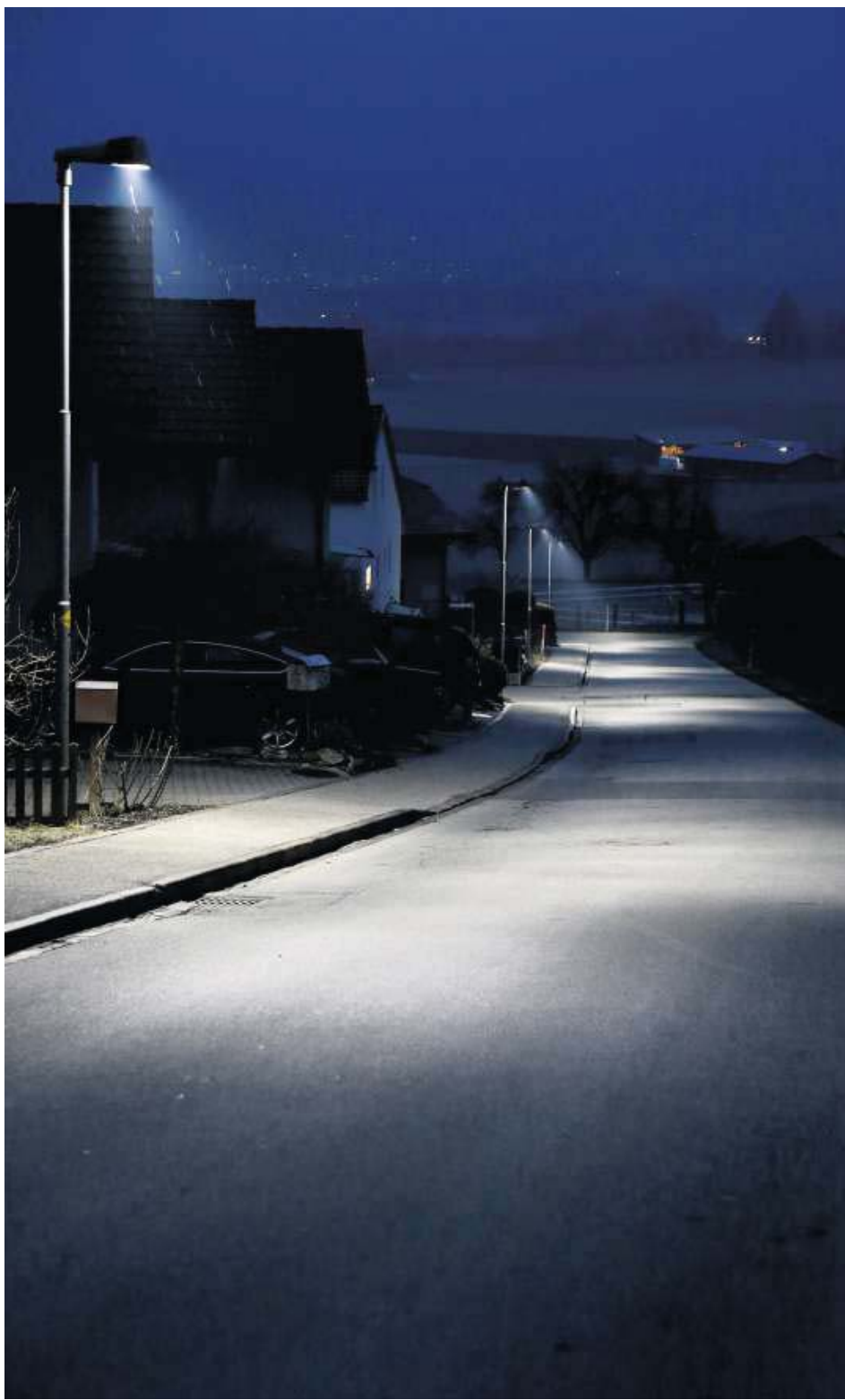
Landquart setzt ausschliesslich auf LED-Leuchten.

Die Rückmeldungen waren jedoch mehrheitlich positiv («endlich herrscht in der Nacht wieder Nacht»), und so wurden Schritt für Schritt weitere Strassen umgerüstet. Inzwischen verfügen gemäss Sutterlet 500 der 3500 Leuchten der Stadt über einen Bewegungsmelder. Am Chemin des Sources tauchten die intelligenten Strassenlampen im Herbst 2015 auf. Als Nächstes wird in der Altstadt von Yverdon ein dynamisches Leuchtsystem installiert. Das Parlament hat Mitte Januar dem Investitionskredit zugestimmt. Mittelfristig schwebt den