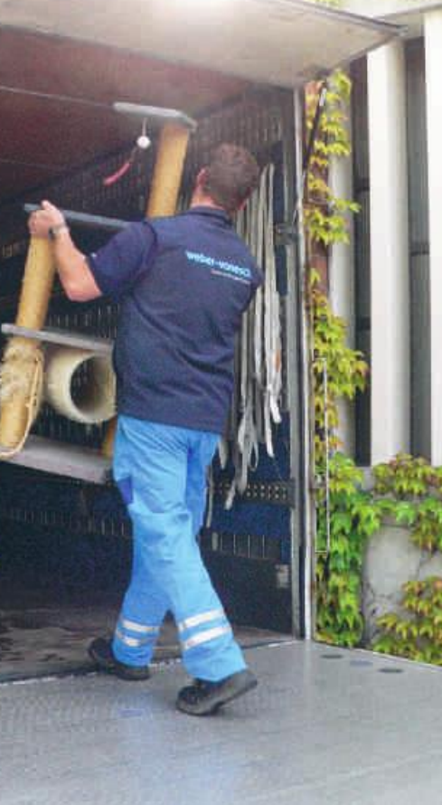
Auch der Katzenbaum musste mit.