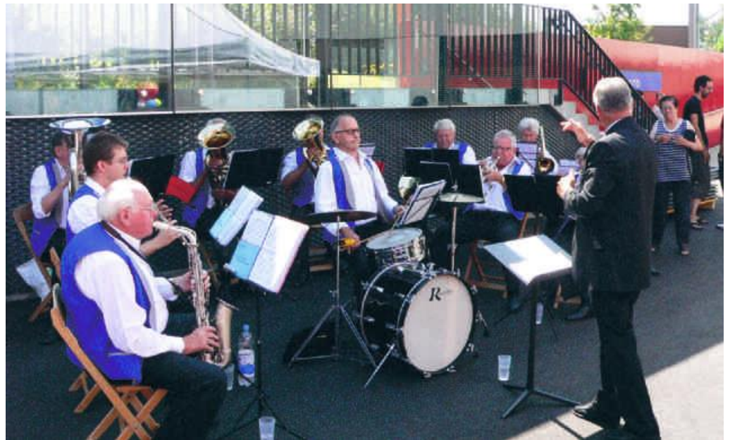
Die Dorfmusik Oberwil sorgte für beschwingte Stimmung.