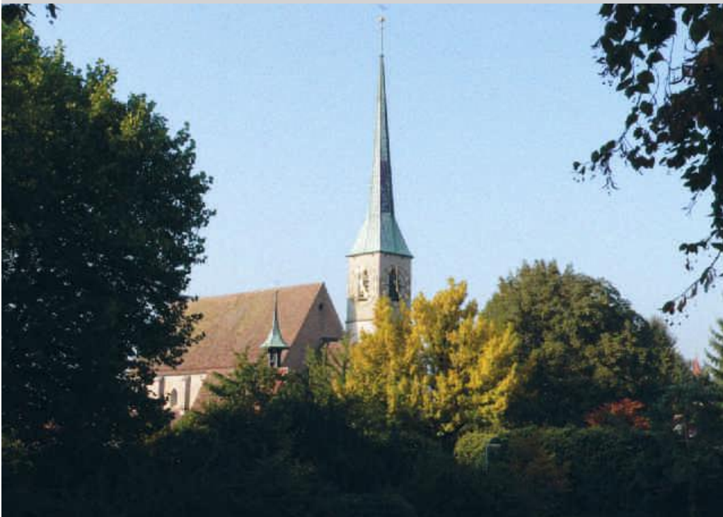
Die Kirche St. Oswald.

31. Die Gemeindeversammlung von Zug bewilligte die notwendigen Kredite zur Planung neuer Sportanlagen.