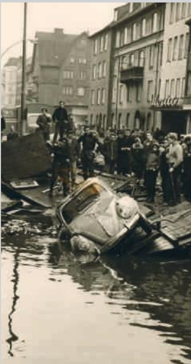
Sturmflut in Hamburg.