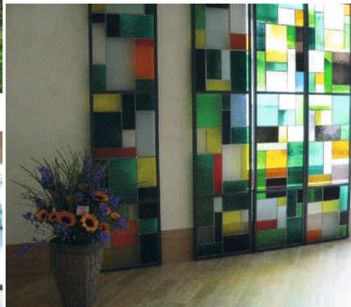
Glaskunst von Veronica Indergand im Andachtsraum.

Info-Tafeln «Berufe mit Menschen für Menschen».