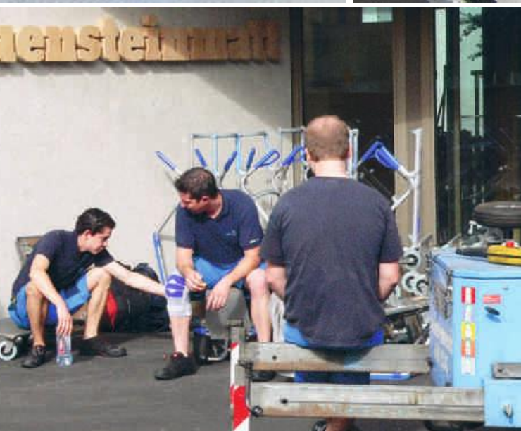
Eine verdiente Verschnaufpause.