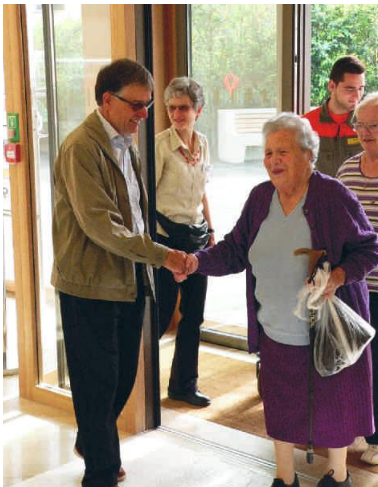
«Willkommen in der Frauensteinmatt!»