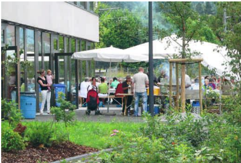
Die Festbeiz lud zum Verweilen ein.