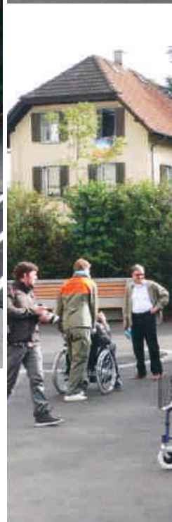
Gemeinsames Frühstück der Pensionäre mit den Männern vom Zivilschutz.