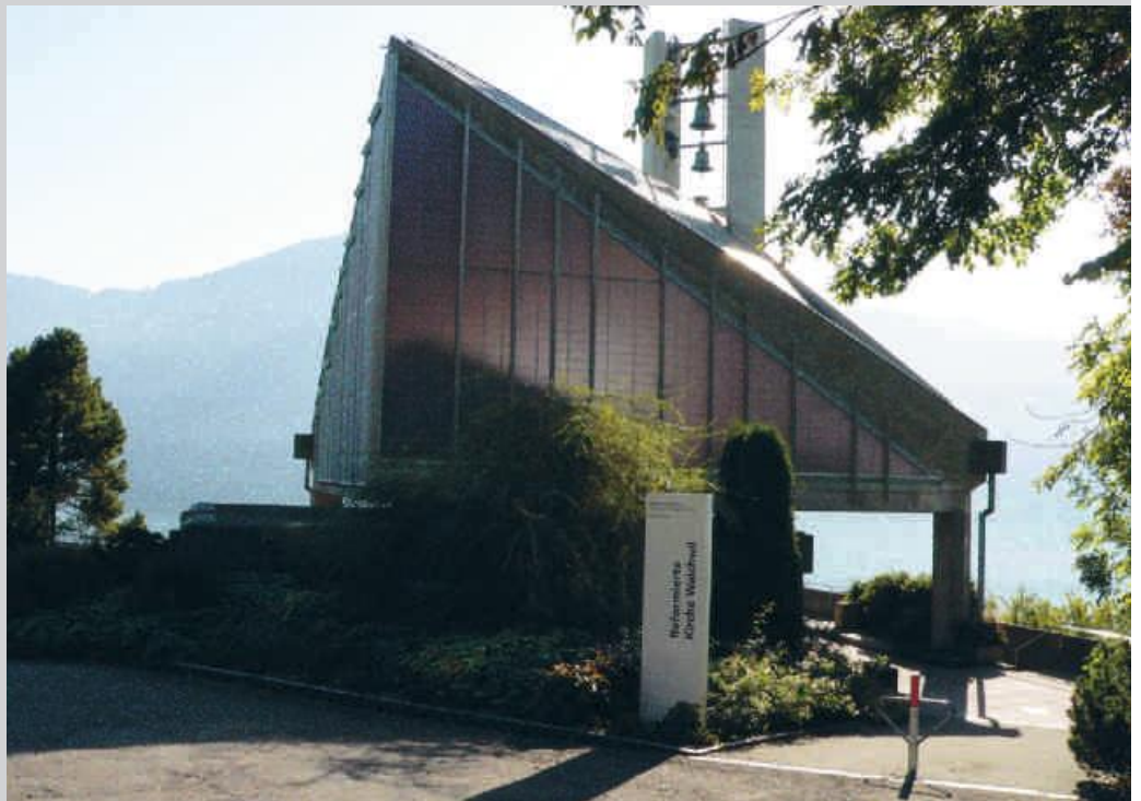
Reformierte Kirche in Walchwil.