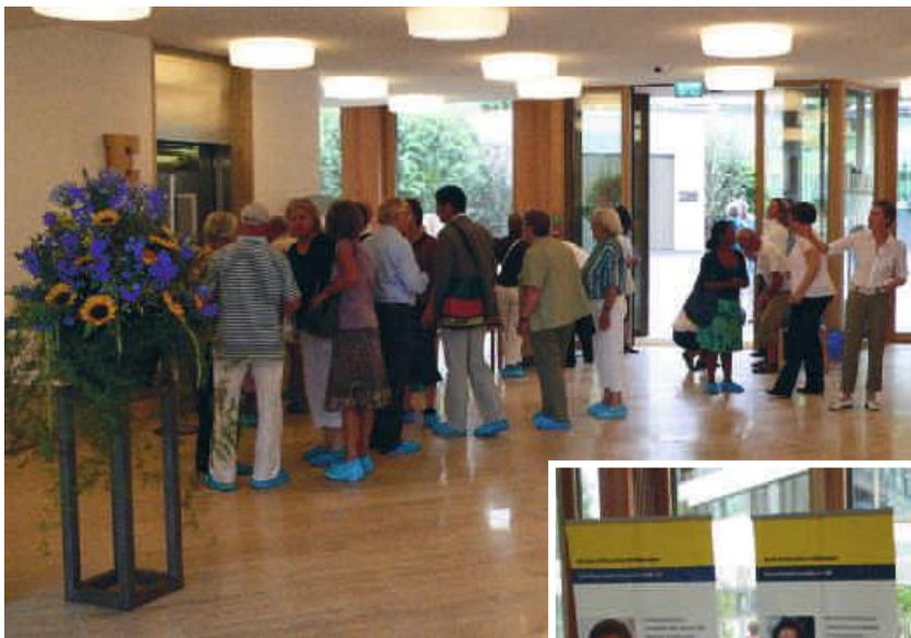
Das Interesse der Bevölkerung war gross.