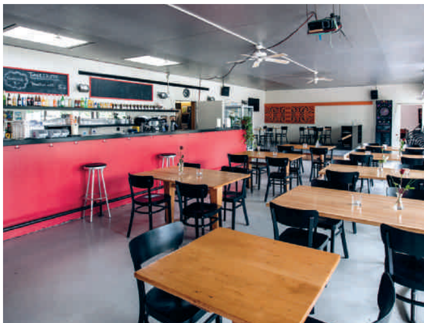
Innenraum des Podium 41

führten. Mit einer neuen Leitung verbesserte sich das Verhältnis. Insbesondere konnte die Gassenarbeit in den Betrieb integriert werden. Dies wurde von der Drogenkonferenz, einem Zweckverband von Kanton und Gemeinden, finanziert. Weiter wurde die Mittagsbeiz im Sommerhalbjahr Teil des Podium 41. Im Jahr 2010 leisteten die ersten Personen im Rahmen eines Arbeitsprojektes im Podium 41 einen Einsatz. Im gleichen Jahr erlangte das Betreibersteam die ISO-Zertifizierung.