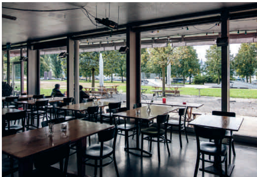
Blick aus dem Podium 41 auf den Vorplatz Richtung See

forderten Ausrichtung zu positionieren und trägt die Hauptlast. Die GGZ ist eine zuverlässige und engagierte Partnerin. Die Trägerschaft durch die GGZ ermöglicht die Nutzung vieler Synergien. So ist es möglich, dass auch Sozialhilfebeziehende im Rahmen der GGZ@Work im Podium 41 ein Praktikum absolvieren können, die Zusammenarbeit mit der Mittagsbeiz konnte ausgebaut werden und verschiedene kulturelle Angebote wurden umgesetzt. Der für die Stadt Zug moderate Anstieg der Kosten um CHF 25 000 pro Jahr ist durch sicherheitsbezogene Anforderungen für das Personal begründet. Hier ist nochmals der freiwillige Beitrag der GGZ in derselben Höhe positiv zu bemerken. Dieser finanzielle Beitrag ist allerdings nur ein Teil der GGZ-Leistung. Der andere Teil ist