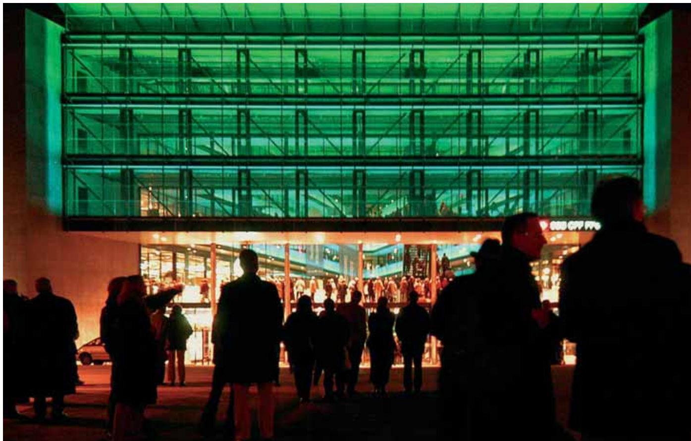
An der Einweihung vom 28. November 2003 nehmen die Menschen «ihren» neuen Bahnhof sofort in Beschlag. Gut ein Jahr später, am 11. Dezember 2004, verkehren die ersten Züge der Stadtbahn, für welche vier neue Haltestellen gebaut wurden.

Als Ergebnis umfangreicher Abklärungen konnte Ende der Legislatur das Modell «Offene Tagesschule» präsentiert werden. Die umfassenden Blockzeiten und die schulergänzende Freizeitbetreuung bilden eine offene Form einer Tagesschule, welche grundsätzlich allen Schülerinnen und Schülern offen steht. Das Quartierschulhausprinzip mit den quartiernahen Schulen für Kinder im Kindergarten- und Grundschulalter wurde beibehalten. Das familienergänzende Kinderbetreuungsangebot konnte in den letzten vier Jahren massiv ausgebaut werden: Heute werden