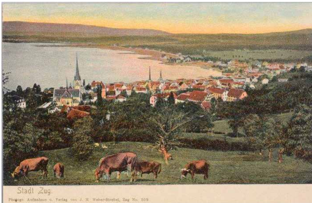
Zug, ca. 1900

Am 8. August drang als Folge eines Rohrbruchs in der Umgebung erneut Wasser in den Kulturgüterschutzraum ein. Auch dieses Mal konnte das schnelle Eingreifen der Feuerwehr Schäden am Bestand verhindern.