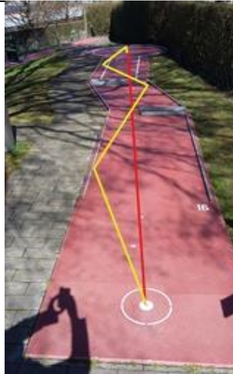
Bahn 16 gelb: Ball: Luxenburger weiss. Zwischen 1. und 2. Schraube an linke Bande. rot: direkt Durchgang ca. 5cm.