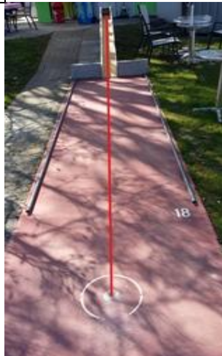
Bahn 18 in mitte Zielen und rein damit. Lach! Ball: nicht zu hart. (springt beim Eingang)