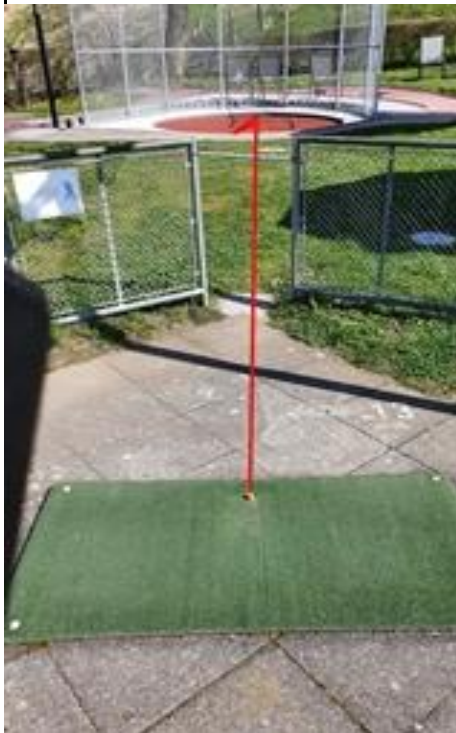
Bahn 13 Weitschlag Ball: Klicker.