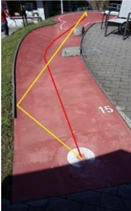
Bahn 15 rot mit Ball Sk 30cm langsam spielen. gelb: Ball: Willisauer blau, Wiedemeier.