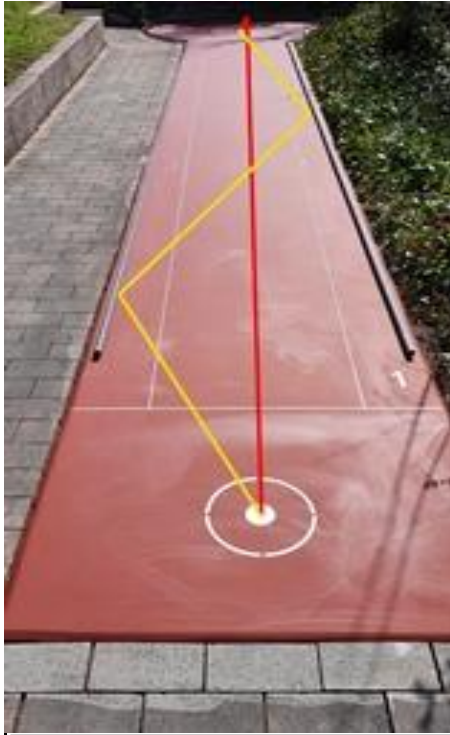
Bahn 1 im Kreis nach rechts hängend. gelb: Ball Lucia&Edy / D087 rot: Ball Sk 30cm. (Sk = Sprungkraft)