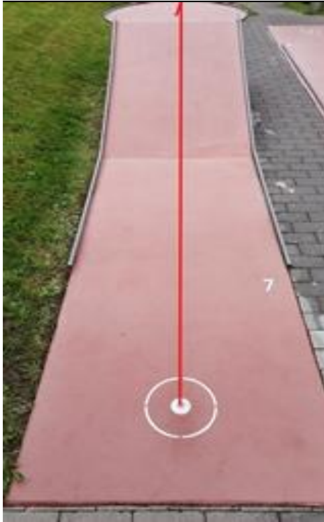
Bahn 7 Ball R351 / 352.