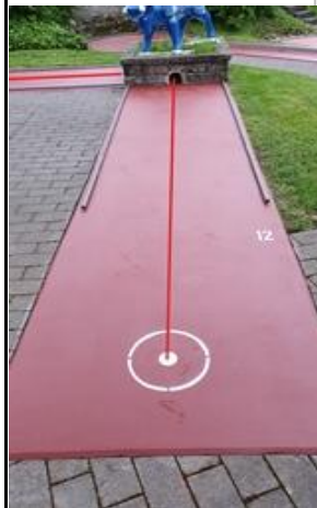
Bahn 12 wird mit hartem, gutlaufendem Ball gespielt (z.B. MG5 / Glasauge).