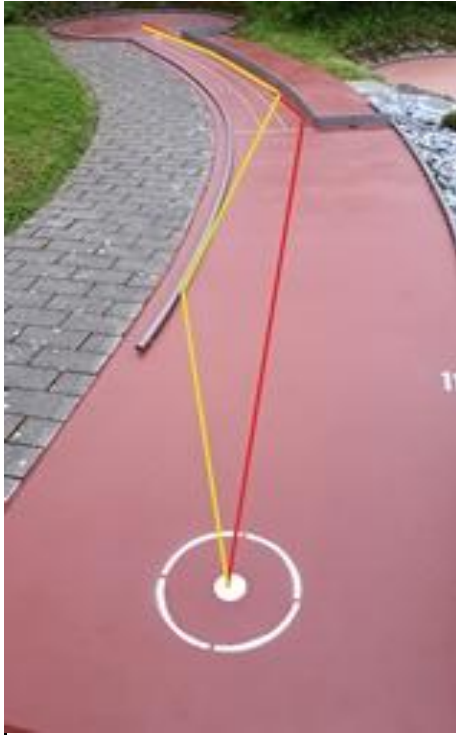
Bahn 11 kann über linke Bande oder direkt mit totem Ball gespielt werden.