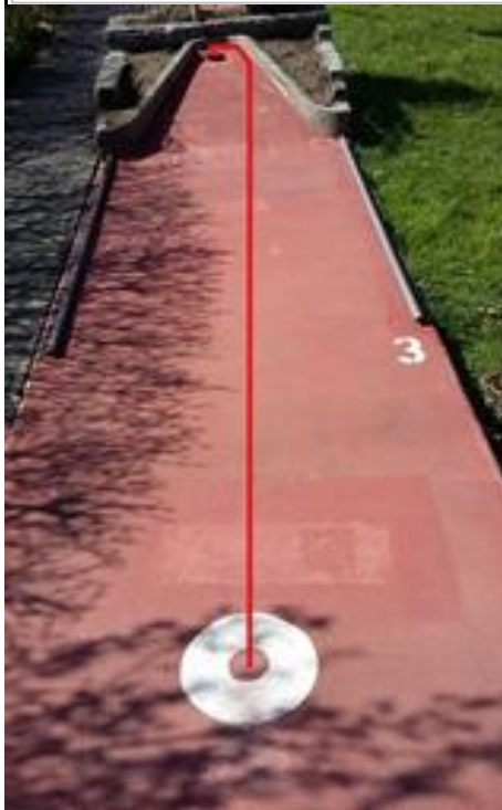
Bahn 3 Ball: plump, schwer, gross, feine Oberfläche, z.B. MG5