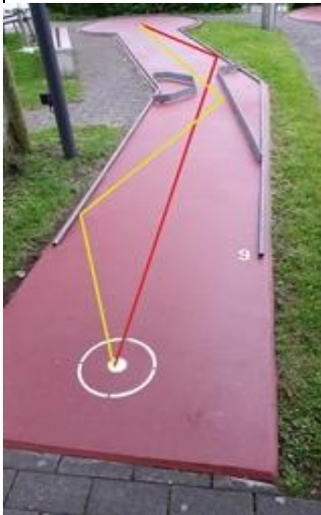
Bahn 9 rot: Ball ,Luca&Edy, Fun for Kids, kurz vor zweiter Schraube. gelb: Ball mit Sk 50cm, ohne Hindernisse zu berühren an rechte

Ball: Tellimat roh, Grencher +16 / +14. möglichst langsam und nahe an den Hindernissen vorbei spielen.