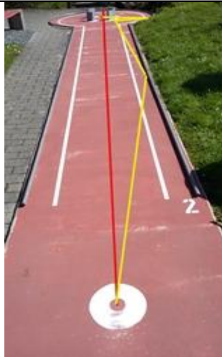
Bahn 2 gelb: Ball Spyder blau, vierte Schraube links, mit Druck spielen. rot: Ball mit Sk 30cm.